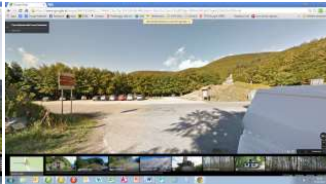
Tag 2: Grenze EmiliaRomagna/Toscana