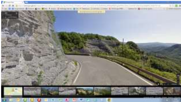
Tag 3: Parco del Monte Coco