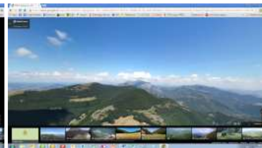
Parco del Monte Cuco