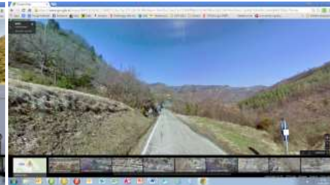
Tag 2: zurück nach Norden