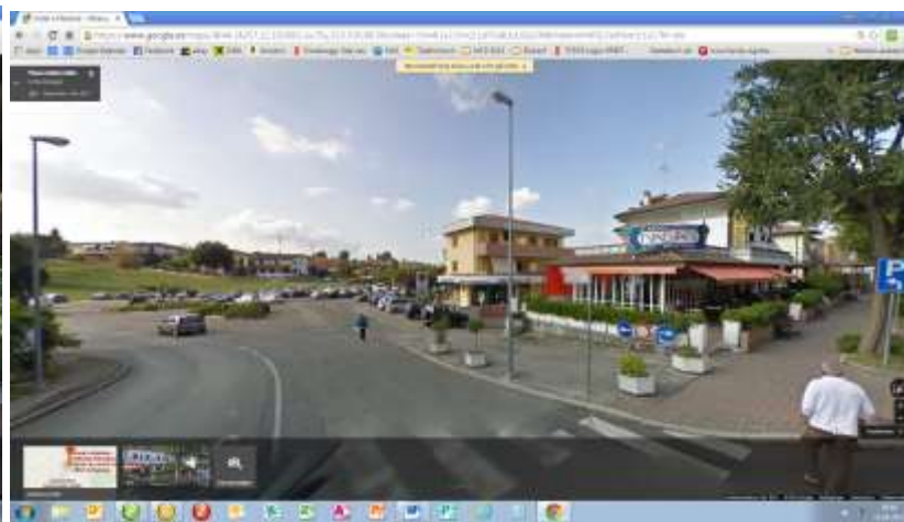
Unsere Unterkunft in Fratta Terme.